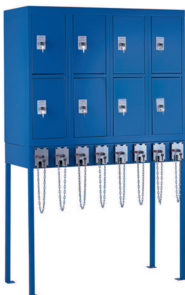
NOV300-2x4-SF sobre MARC1200 4P 8C

Las consignas monedero son el conjunto monobloc que forman un marco con una taquilla de la gamma SM o SM SI con todas sus características.